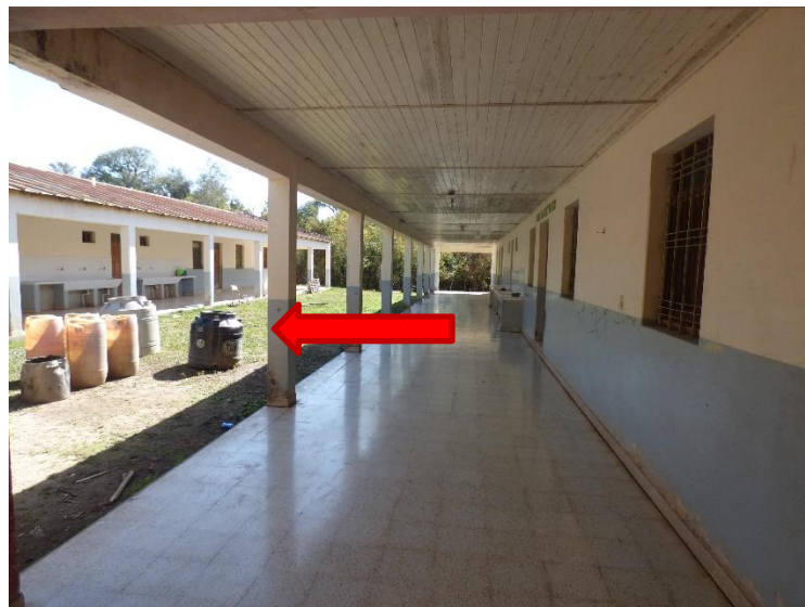
Recipientes a la intemperie donde se almacena el agua para la higiene de todos los que estábamos en la Escuela (agua no potable)