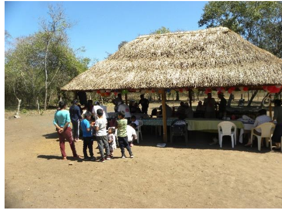
Lugar que se utiliza en Agujón en reemplazo de la Escuela Rancho Baule