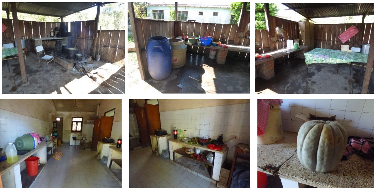
El lugar donde se cocina y calienta el agua (incluso para bañarse) para toda la escuela

⇒ La Escuela Rancho de Baule, además de ser de madera, no cuenta con baños sino con letrinas. No cuenta con ninguna infraestructura digna y segura para que los niños de la zona, como también los docentes puedan recibir y dar educación respectivamente por lo cual dan clase en Agujón en una escuela improvisada con techo de paja y sin paredes.