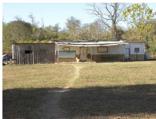
Escuela Rancho N°4814 Finca Baule